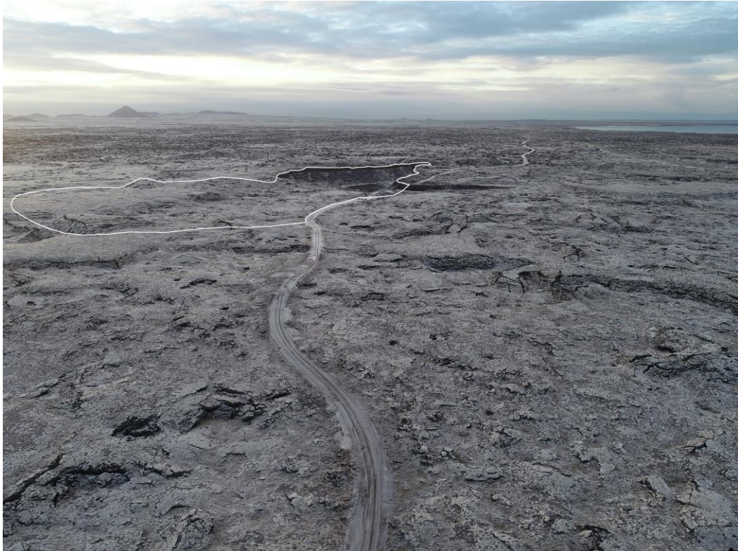
Mynd 7.2 Fyrirhugað vinnslusvæði við Rauðamelnámu

Stefnt er að því að flytja 180.000 m 3 11 af stórgrýti og mulningi úr Rauðamelnámu. Mynd 7.2 sýnir fyrirhugað vinnslusvæði við námuna. Efnistakan mun breyta ásýnd og landslagi við námuna. Náman er lítið sýnileg frá Reykjanesbraut. Hins vegar er göngu- og hjólastígur skilgreindur í gegnum svæðið og mun náman hafa neikvæð áhrif á ásýnd frá göngu- og hjólastíg.