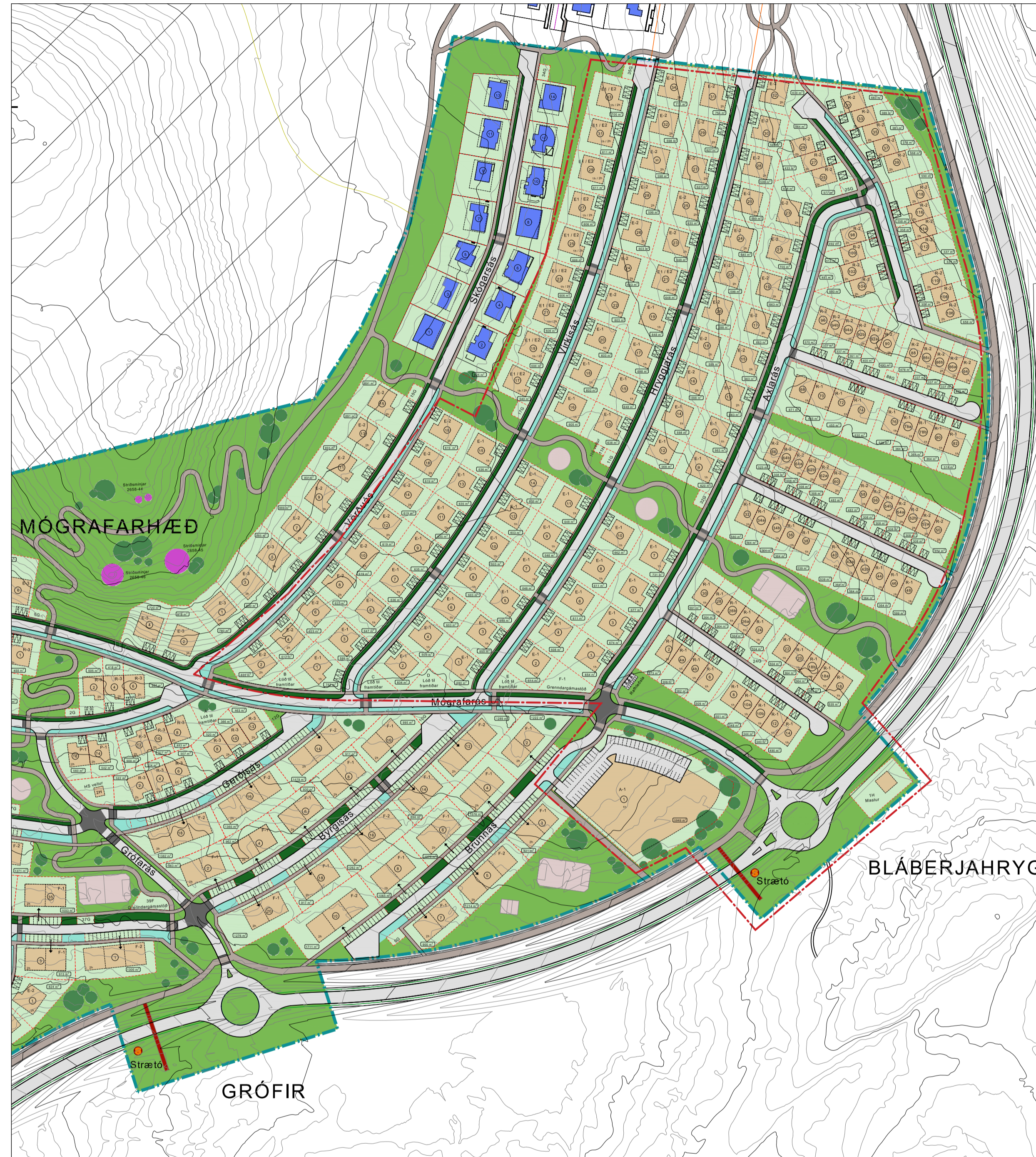
Mkv. 1:2000, Deiliskipulagsuppráttur eftir breytingu.