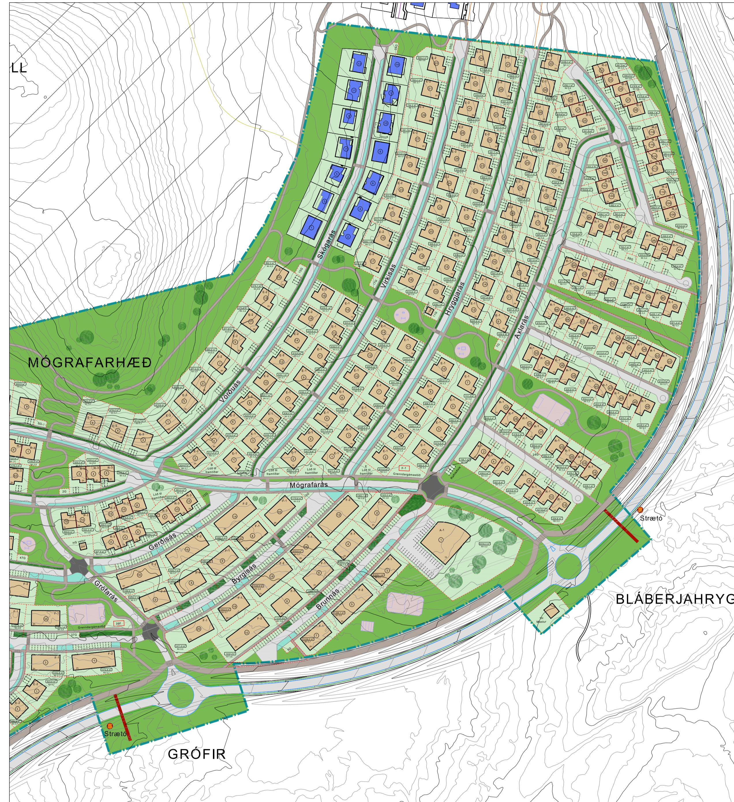
Mkv. 1:2000, Deiliskipulagsuppráttur.

Almennt Í gildi er deiliskipulag fyrir Ásland 4.