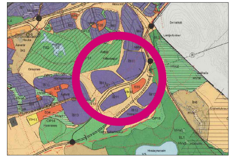
HLUTI ADALSKIPULAGS HAFNARFJARÐAR 2013-2025