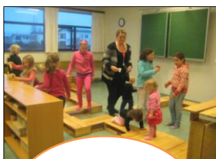
Hlutbundin vinna í gegnum leikinn